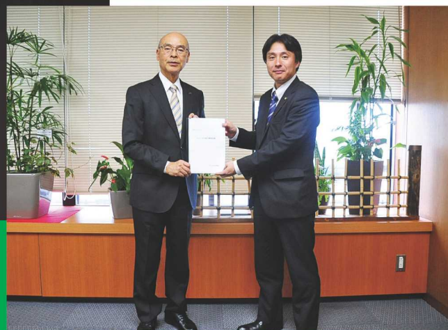
青木区長への予算要望